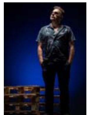
Rockin'Squat, leader du groupe Assassin.

Séance de dédicace de 17 heures à 19 heures au Rétro music shop, 9 rue du Sapin-Vert à Tourcoing. Tél. : 07 86 71 79 07.